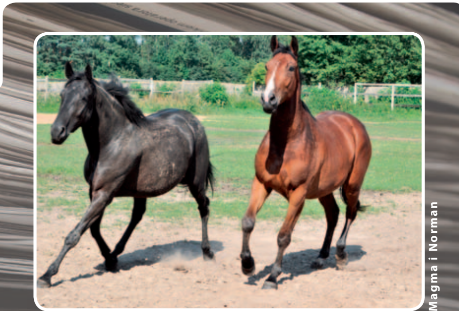
Magma i Norman