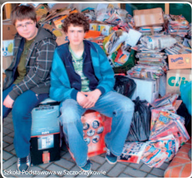
Szkoła Podstawowa w Szczodrzykowie

uczy jak chronić środowisko i pomagać zwierzętom