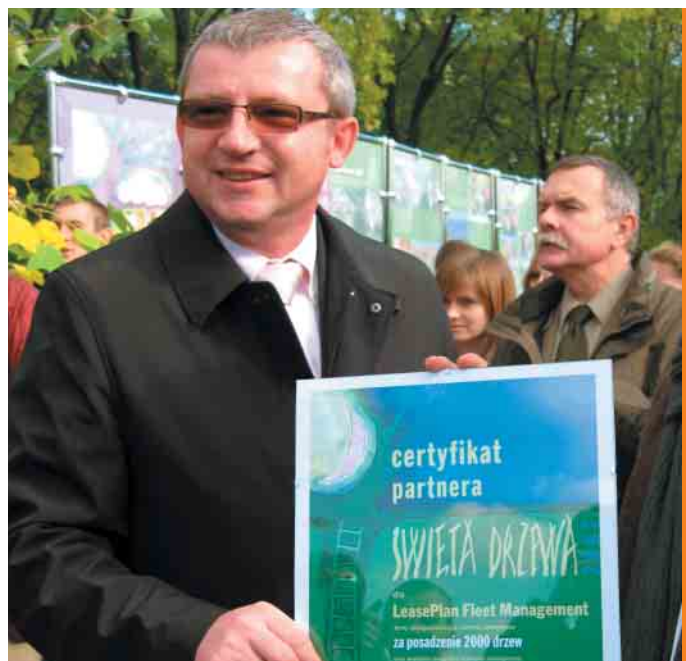
Prezes LeasePlanu odbiera certyfikat partnera Święta Drzewa

W minionym roku kontynuowaliśmy współpracę z firmami, które zaangażowały się w ochronę środowiska i wspierały edukację ekologiczną w szczególności program Święto Drzewa . W Warszawie podczas inauguracji Święta Drzewa rozdaliśmy partnerom Certyfikaty Święta Drzewa 2007 : firmie Troton za posadzenie 5 tysięcy drzew, Eco Service za posadzenie 3 tysięcy drzew, firmie LeasePlan za posadzenie 2 tysięcy drzew. Pracownicy firmy LeasePlan, jak co roku zaangażowali się w Święto Drzewa i posadzili 150 drzew w Nadleśnictwie Chojnow.