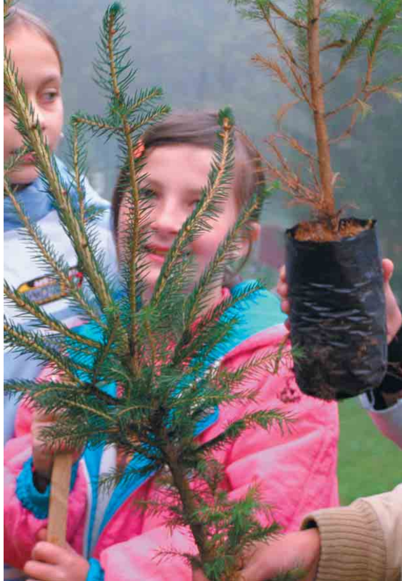
Uczennice ze Szkoły Podstawowej w Żmiącej, sadzą drzewa