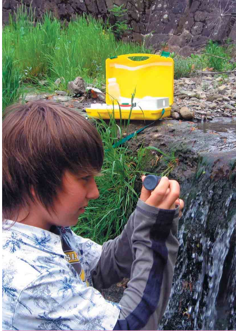
Szkoła Podstawowa nr 2 w Mszanie Dolnej

Program Zaadoptuj rzekę dofinansowany był ze środków Narodowego Funduszu Ochrony Środowiska i Gospodarki Wodnej oraz WFOŚiGW w Katowicach.