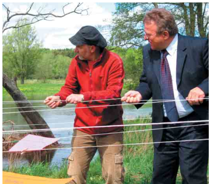
Prezes Klubu Gaja i Prezydent Miasta Kołobrzeg ślą życzenia dla Parsęty