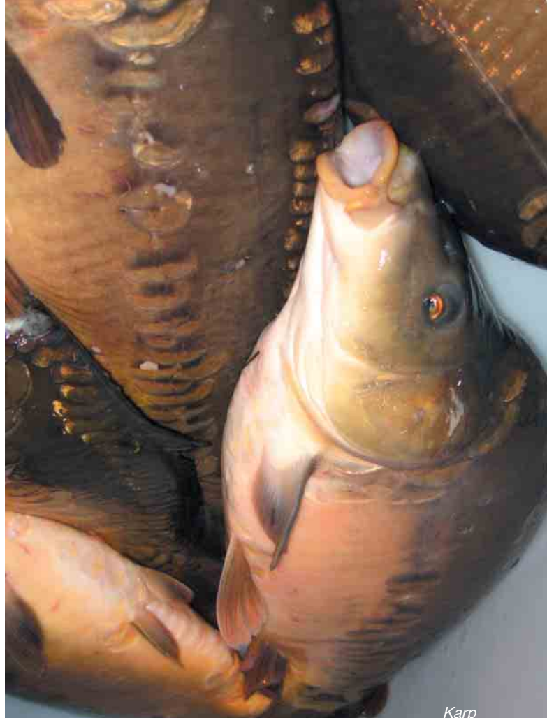
Karp Karp Jacek

W Warszawie zorganizowaliśmy konferencję prasową i symboliczną akcją wykupu żywych karp, które zostały wypuszczone na wolność do Jeziora Szczęśliwickiego. Złożyliśmy także w Ministerstwie Rolnictwa i Rozwoju Wsi pismo, w którym domagamy się wprowadzenia zmian w polskim prawodawstwie dotyczącym ryb hodowlanych. W ocenie Klubu Gaja Ustawa o ochronie zwierząt z dnia 21 sierpnia 1997 roku nie obejmuje zakresem swojego zastosowania ryb hodowlanych. W konsekwencji okrutne traktowanie ryb hodowlanych, w szczególności karpki w okresie przedświątecznym, pozbawione jest jakiegokolwiek sankcji. Obecny porządek prawny pozostaje w sprzeczności ze stanem prawnym przyjętym w Unii Europejskiej. Minimalne standardy ochrony ryb hodowlanych w prawie unijnym zostały określone w Dyrektywie 98/58/WE. Obowiązkiem Polski, jako państwa członkowskiego Unii Europejskiej, jest dostosowanie prawa krajowego do prawa wspólnotowego. W związku z czym Klub Gaja zwrócił się z prośbą do Ministra Rolnictwa i Rozwoju Wsi o zainicjowanie prac legislacyjnych mających na celu objęcie ochroną ryb hodowlanych. Karp Też chce do Unii!