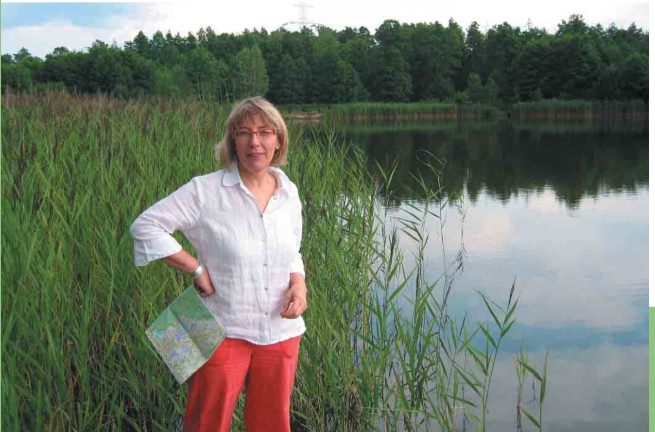
Rybnik – Kamień

Czwartek 26 kwiecień – Urząd Miasta Rybnika w czasie dyskusji z mieszkańcami oznajmia, że ma zamiar przeprowadzić dwie asfaltowe szosy przez las, przez teren Parku Krajobrazowego. Są głusi na argumentację mieszkańców, że drogi zniszczą najładniejszą dzielnicę Rybnika – Kamień i las, który jest ważnym korytarzem ekologicznym.