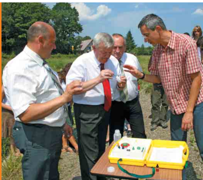
Starosta Powiatu Limanowskiego bada wodę w potoku Sowilina

Firma Troton po raz drugi zorganizowała wielkie sprzątnięcie rzeki i wielki piknik nad Parsętą. W ramach programu Zaadoptuj rzekę przygotowaliśmy happening Życzenia dla rzeki , do Parsęty pisali mieszkańcy, wędkarze, pracownicy Trotona, samorządowcy, m.in. Prezydent Miasta Kołobrzeg. Zapraszamy firmy do współpracy!