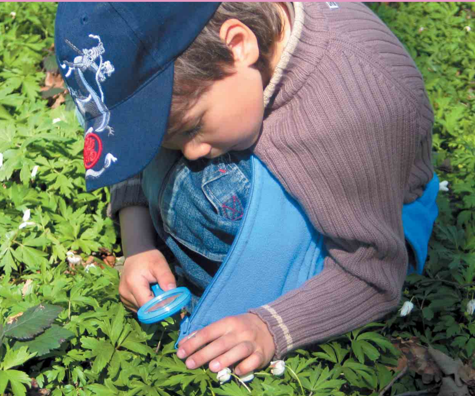
Przedшкоlaki z Bystrej na ścieżce dydaktyczno-przyrodniczej Klubu Gaja

Żyjemy w świecie, który jest w coraz większym stopniu globalny. To oznacza, że nasze życie jest coraz bardziej splecione z życiem innych ludzi na całym świecie. Jednocześnie w naszym świecie zwiększają się rozbieżności i nierówności. Jest oczywiste, że globalne problemy, takie jak zmiana klimatu, bieda, zanikanie różnorodności biologicznej czy konflikty na świecie – wymagają ogólnoswiatowych rozwiązań. Dlatego potrzebna nam jest edukacja kształtująca postawy odpowiedzialne i zaangażowane w procesy globalnych współzależności i wyzwań jakie przed nami stają.